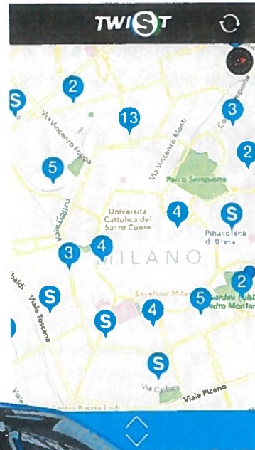
La app di Twist e una vettura dell'ultimo nato tra i servizi di car sharing milanesi.