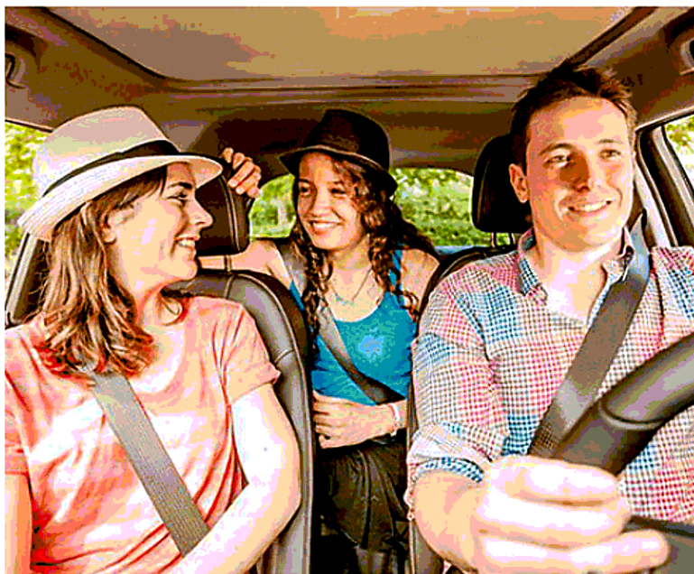
Cresce l'uso dell'auto condivisa per gli spostamenti verso le vacanze

Brevi o lunghe che siano, l'importante è non rinunciare alle comodità. Per le vacanze gli italiani di solito non badano a spese ma, in periodi di crisi, la tendenza è quella di viaggiare low-cost. Obiettivo? Risparmiare sul budget, soprattutto quando si tratta di spostamenti. È un trend sempre più diffuso quello di condividere un viaggio per ridurre le spese, non solo per lavoro, ma anche per svago. La conferma arriva da BlaBlaCar, la piattaforma che mette in contatto gli automobilisti con posti liberi a bordo della loro auto per dividere le spese di viaggio a beneficio del traffico, dell'ambiente e del portafogli. Nell'ultimo weekend di giugno sono stati offerti 40mila posti in auto. Nel mese di luglio, solo per raggiungere le mete del weekend, la stima è di almeno 75mila persone che viaggeranno usufruendo del servizio di passaggi in auto e per l'esodo di agosto le previsioni sono decisamente più alte: secondo la piattaforma online infatti saranno offerti oltre 250mila passaggi. Un dato in rialzo rispetto al 2015 con picchi per le tratte da Milano alle mete vacanziera della Romagna (+74%), da Bologna alle località montane del Trentino Alto Adige (+85%) e sulla tratta Roma-Bari (+58%), molto attiva anche nel resto dell'anno. Per quanto riguarda i viaggi all'estero, l'estate scorsa sono stati offerti su BlaBlaCar 67.600 viaggi condivisi dall'Italia alla Francia, 27.780 verso la Germania e 4.700 verso la Spagna: una tendenza che, secondo le previsioni, è desti-