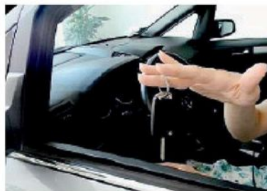
BOOM DI AUTO CONDIVISE E A NOLEGGIO