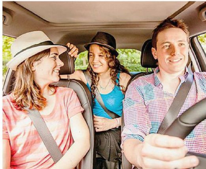
Cresce l'uso dell'auto condivisa per gli spostamenti verso le vacanze

rispetto alle 145mila unità del 2015 con un target che potrebbe superare i 150mila veicoli a noleggio». A determinare l'incremento, secondo Benincasa, soprattutto «l'aumento degli stranieri che scelgono l'Italia come meta sicura rispetto ai problemi legati al terrorismo». La compagnia di noleggio Hertz che, per quanto riguarda le sole prenotazioni del mese di luglio e agosto, ha già messo a segno un +4% rispetto al 2015.